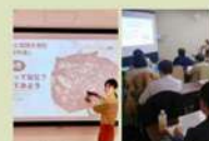
実践のための講座 & コンテンツ提供