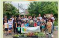
公園花壇での実践提供 & コミュニティ運営