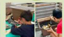
コンポスの普及 & 実践支援